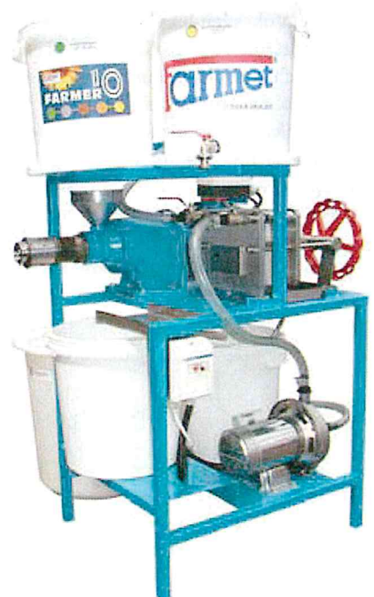
Zařízení Farmer